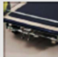
11381 Option Frein centralisé